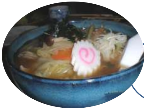
ポリューム ムたっ ぷりのす いとん

2日目の昼食は、地元の方との意見交換会も兼ねました 皆さんにみなかみ町の感想を聞いたり、ご意見をいただきました